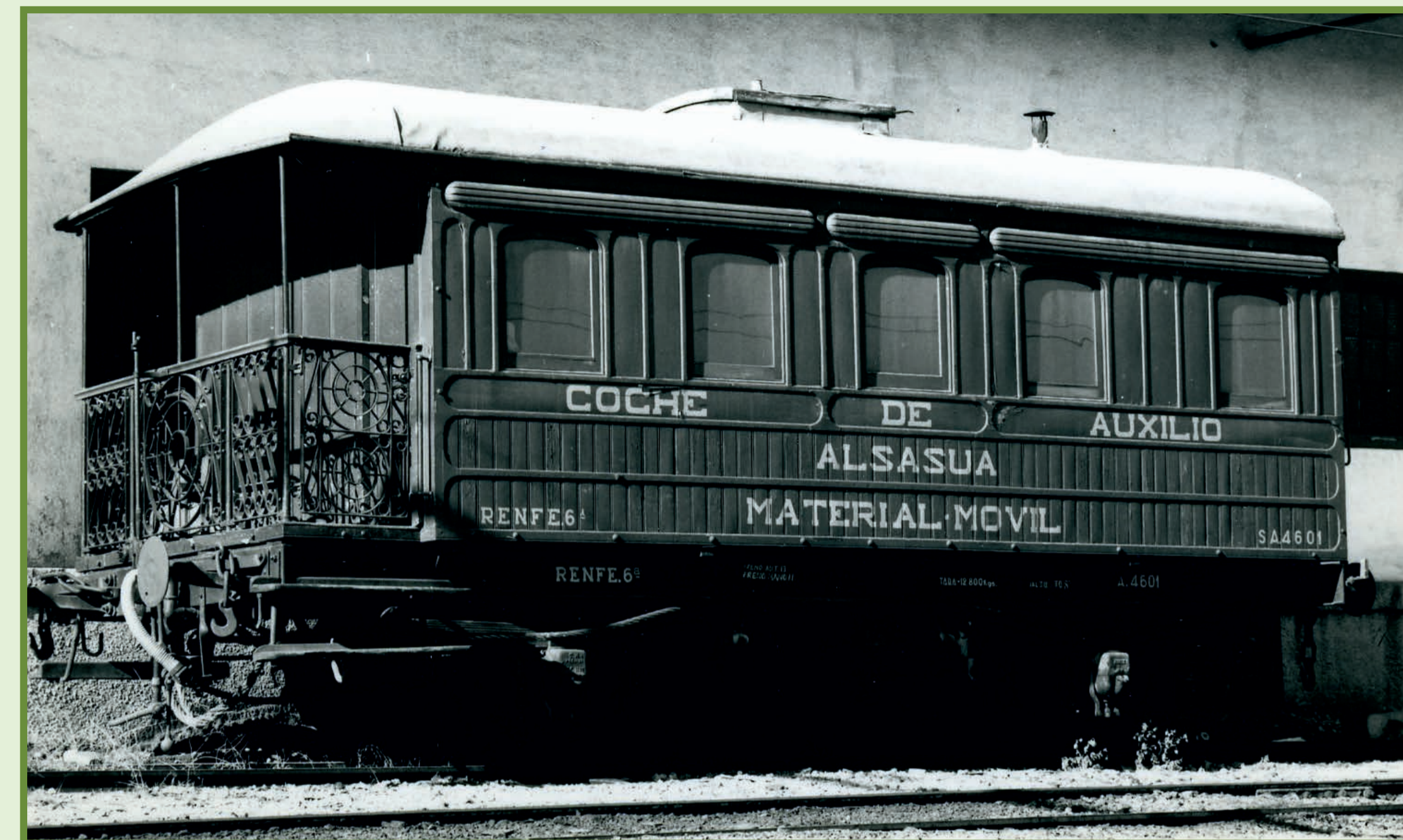
Exhibit IG 152

RENFE assigned it in 1977 to Madrid's future Railway Museum. In 1984, its original appearance was restored both inside and outside in RENFE's forestry division “Explotaciones Forestales” in Soria.