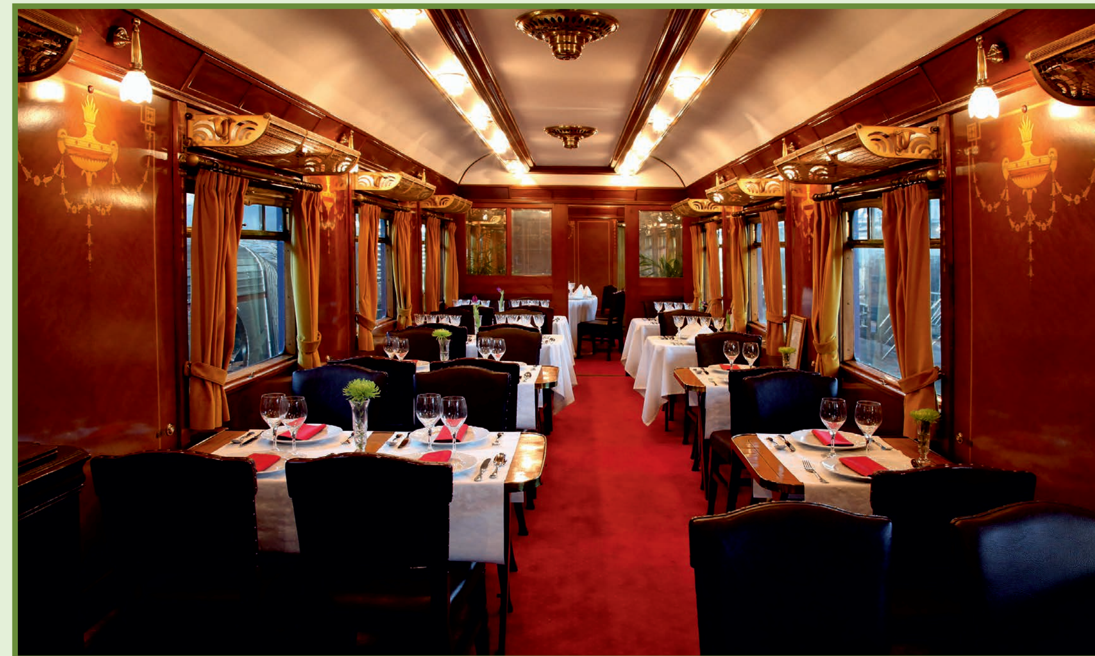
Exhibit IG 2202

Finally, RENFE gave the entire R12-12000 subseries to the Railway Museum in the late nineties, being used for special and tourist services. This car, decorated inside with marquetry featuring ram heads and censers with wreaths, is also suitable for holding meetings or conferences since its tables can be folded and its chairs moved.