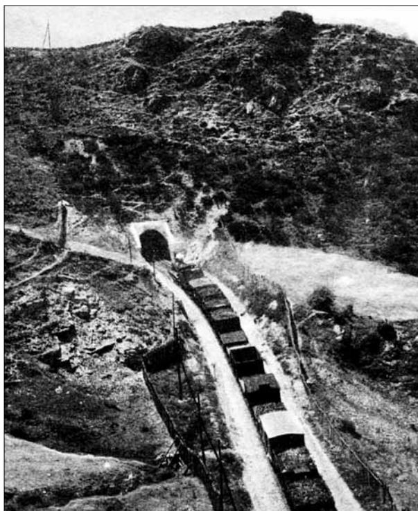
FIG. 3. Tren de mercancías similar al que protagoniza el relato Santa Olaja de acero a punto de entrar en uno de los túneles del puerto de Pajares. Postal, ca. 1930.

A continuación nuestro escritor da a entender que ambos ferroviarios llevan largo tiempo conduciendo la vieja locomotora hasta el punto de otorgarle una cierta personificación, convirtiéndola en una prolongación de ellos mismos: «La máquina era para los dos, en la compañía del trabajo, Olaja ; Olaja y nada más. A veces le llamaban la señora, pero lo decían irónicamente, porque ellos no eran señores y una compañera de trabajo tampoco podía ser señora» (Aldecoa, 1995, p. 357). Una compañera hacia la que llegaban a sentir la admiración que desprende el comentario de Mendaña: «Vamos con la hora. La señora marcha bien a pesar de los años. ¡Qué material el de antes!» (Aldecoa, 1995, p. 359). Una admiración que se vería hartamente justificada si se tiene en cuenta que la vetusta Olaja sacrifica su propia existencia para salvar la vida a sus dos compañeros, así como las del jefe de tren y los tres guardafrenos repartidos por las garitas de los vagones.