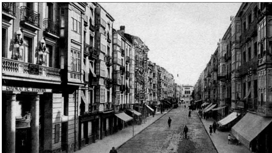
FIG. 4. Vitoria. Calle de Eduardo Dato y Estación del Norte. Postal, Ed. Arribas, ca. 1930.

de la ciudad. Para llegar a la ciudad el camino más corto era el del ferrocarril, pero el padre lo tenía prohibido. (Aldecoa, 1996, pp. 118-119).