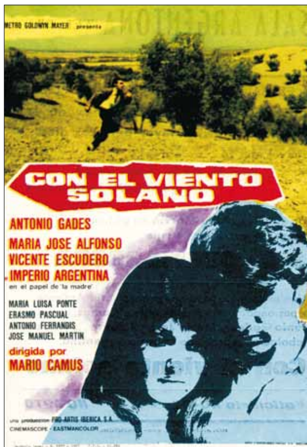
FIG. 2. Folleto de Con el viento solano . Imprenta Arenas Argentona (Barcelona), 1971.

vación de la realidad extraída de correrías urbanas y de excursiones por el medio rural.