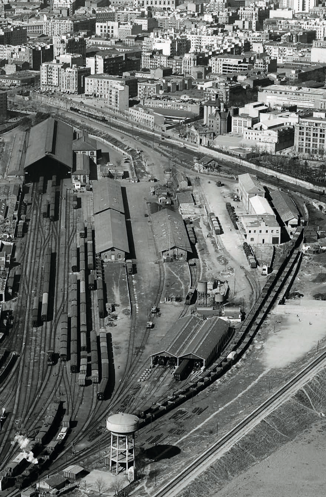
Vista aérea de la estación de Madrid-Delicias en 1961.