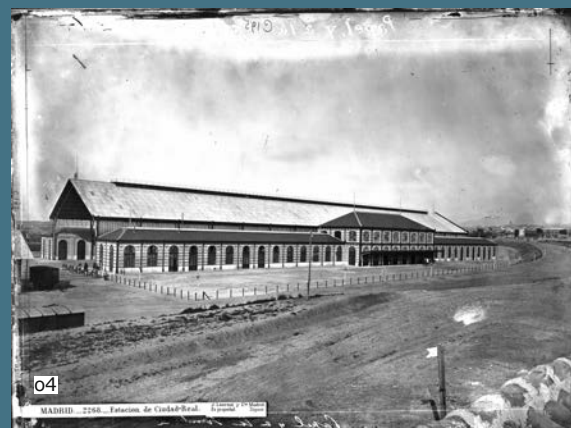
01. Modificaciones del proyecto, fachada norte. 2-ago-1879.